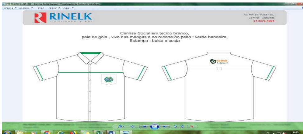
Figura 3 - Modelo do Uniforme da Equipe Administrativa