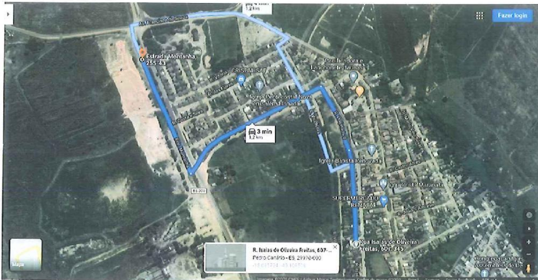
Imagem aérea – Local de descarte de material retirado da terraplanagem da construção da Unidade Básica de Saúde, Distrito Cristal do Norte, com distância de 1,2km.

TR-202-01 (Comercial - Caminhão basculante) - 0,665XP + 0,692XR