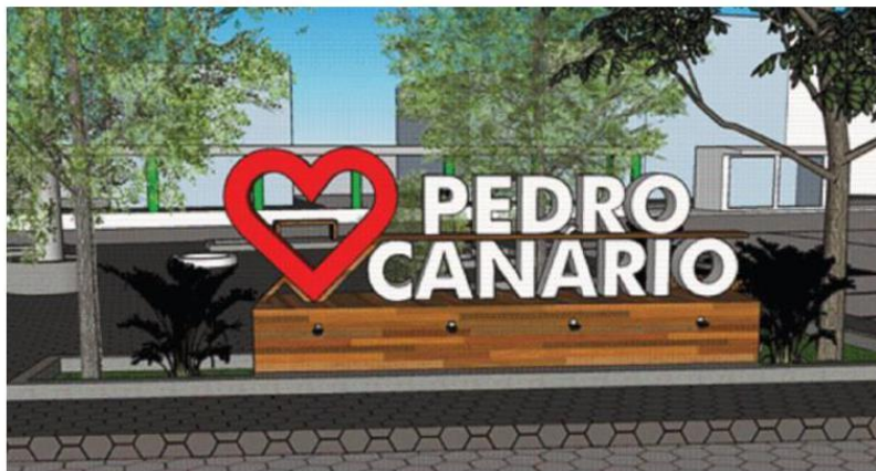
Perspectiva em 3D

LETREIRO - LOTE 02: Localizado na Praça da Rodoviária - Rua Caltem, Bairro Centro.