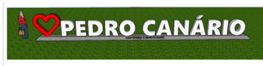
Perspectiva em 3D

LETREIRO - LOTE 01: Localizado na Praça da Lagoa Augusto Ruschi - Avenida Presidente Kennedy e Rua Conceição da Barra, Bairro Centro.